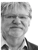
von Bernhard Lassahn zu Person und Archiv - Webseite - Mail schicken

Kramer fordert Lockerungen beim geplanten Einwanderungsgesetz Arbeitgeberpräsident will mehr ungelernte Zuwanderer nach Deutschland holen