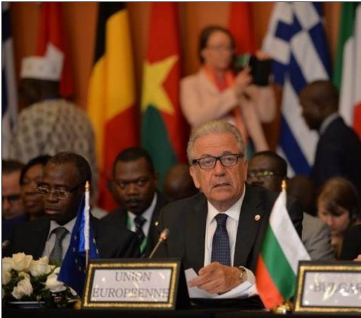
Dimitris Avramopoulos (center), the EU Commissioner for Migration, Home Affairs and Citizenship, at the Fifth Euro-African Ministerial Conference on Migration and Development in Marrakesh on May 2, 2018.

The Euro-African Ministerial Dialogue on Migration and Development was founded in 2006 to contain migration from Africa into Europe , specifically, at the time, the increase of migrants crossing the Strait of Gibraltar from Morocco into Spain and from there into the rest of Europe.